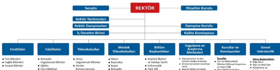
Tablo 9a. Üniversite Organizasyon Şeması

Rektörlük, enstitü, fakülte, bölüm, enstitü ana bilim dalı ve varsa diğer alt birimler düzeyindeki tüm karar alma süreçlerini anlatınız ve bunları program çıktılarının gerçekleştirilmesi ile eğitim amaçlarına ulaşılması açısından irdeleyiniz. Enstitü müdürünün ve müdür yardımcılarının ve enstitünün üniversite içerisindeki yerini gösteren bir organizasyon şeması hazırlayınız ve şemayı Organizasyon Şeması olarak adlandırınız. Şemada enstitünün bağlı olduğu kişilerin unvanlarını belirtiniz (akademik işlerden sorumlu rektör yardımcısı, enstitü müdürü gibi).