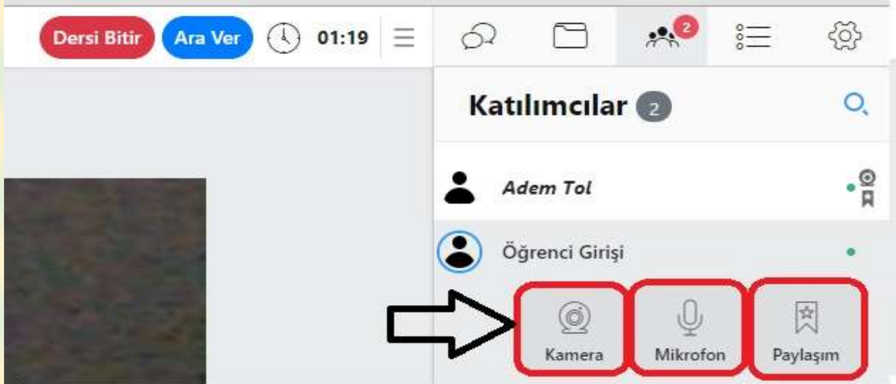
Şekil 4. Yöneticiyseniz katılımcılara kamera ve mikrofon daveti gönderiniz.

Sınav başladıktan sonra yöneticinin, her bir katılımcı için kamera ve mikrofonu açması gerekmektedir.